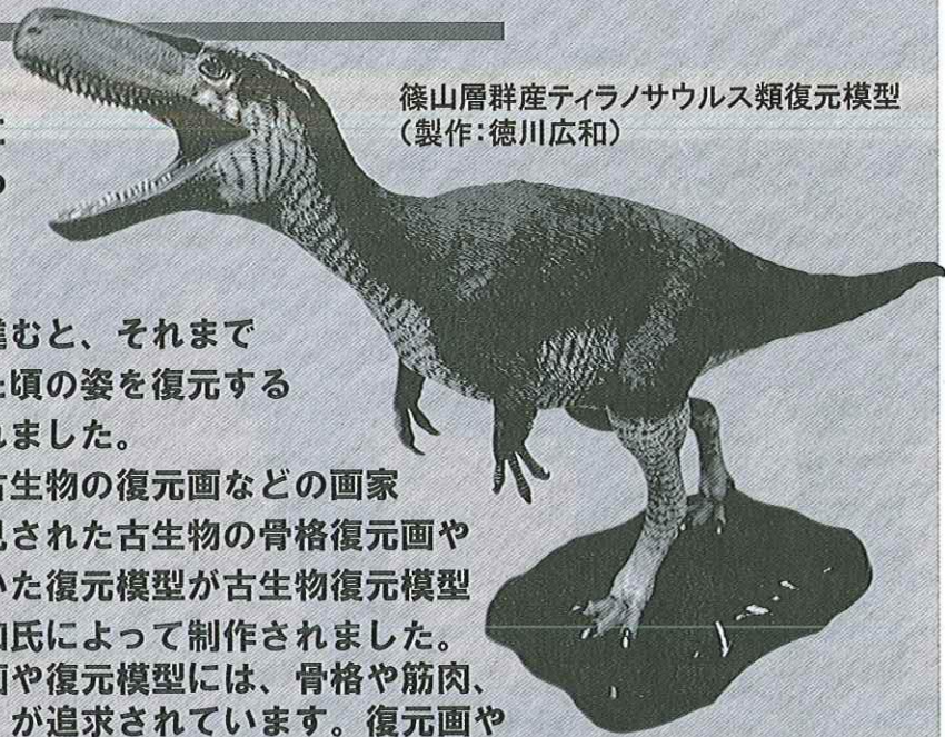
篠山層群産ティラノサウルス類復元模型 (製作:徳川広和)

最新の研究成果をもとに制作された復元画や復元模型には、骨格や筋肉、皮膚、色、息遣いなどの徹底的な「リアル」が追求されています。復元画や復元模型からは、立体的に具現化された絶滅動物の生き生きとした姿を垣間見ることができるだけでなく、芸術作品（アート）としての技術や価値も見てとれ、多方面にわたり作品を楽しむことができます。