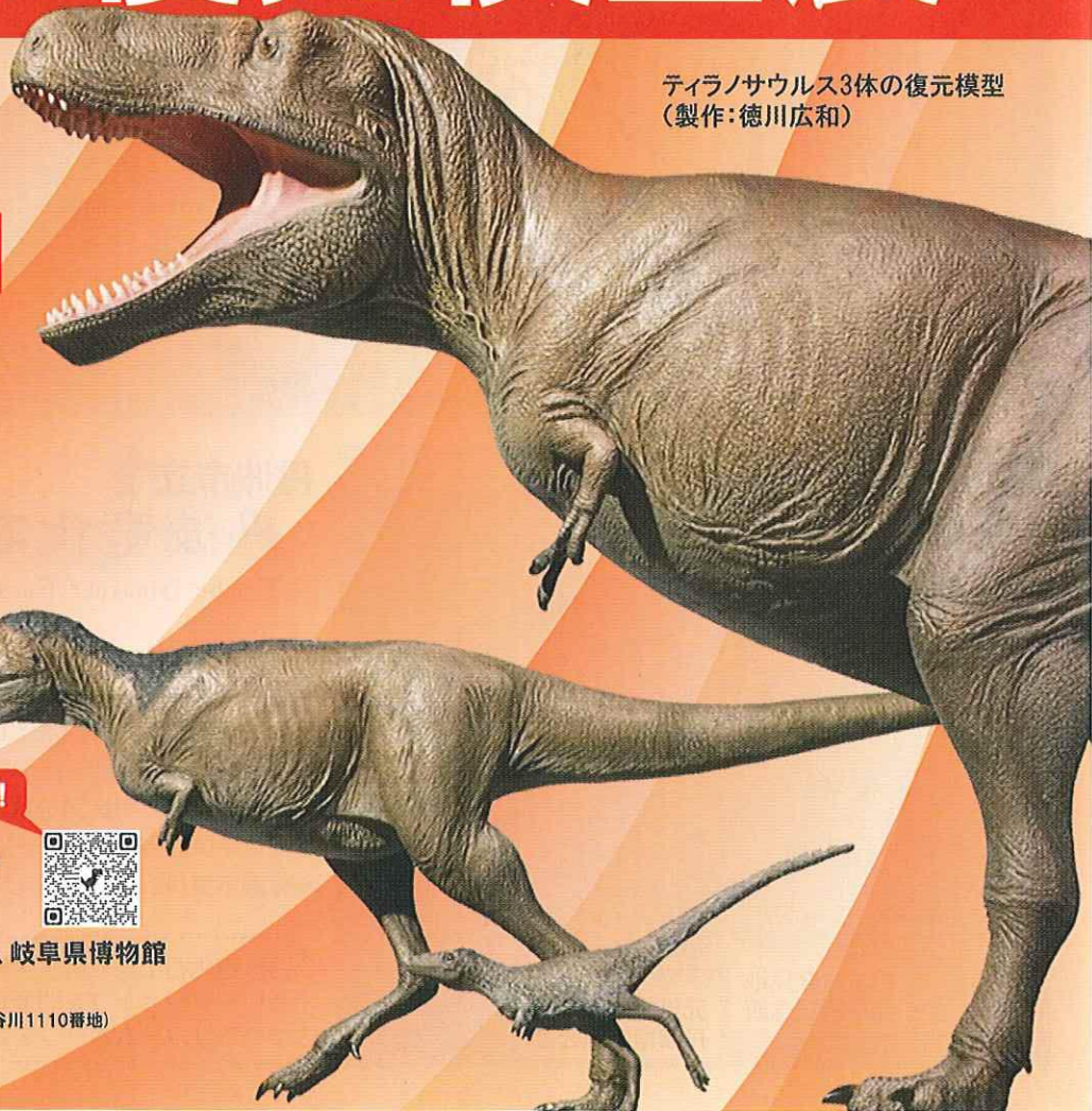
ティラノサウルス3体の復元模型 (製作:徳川広和)