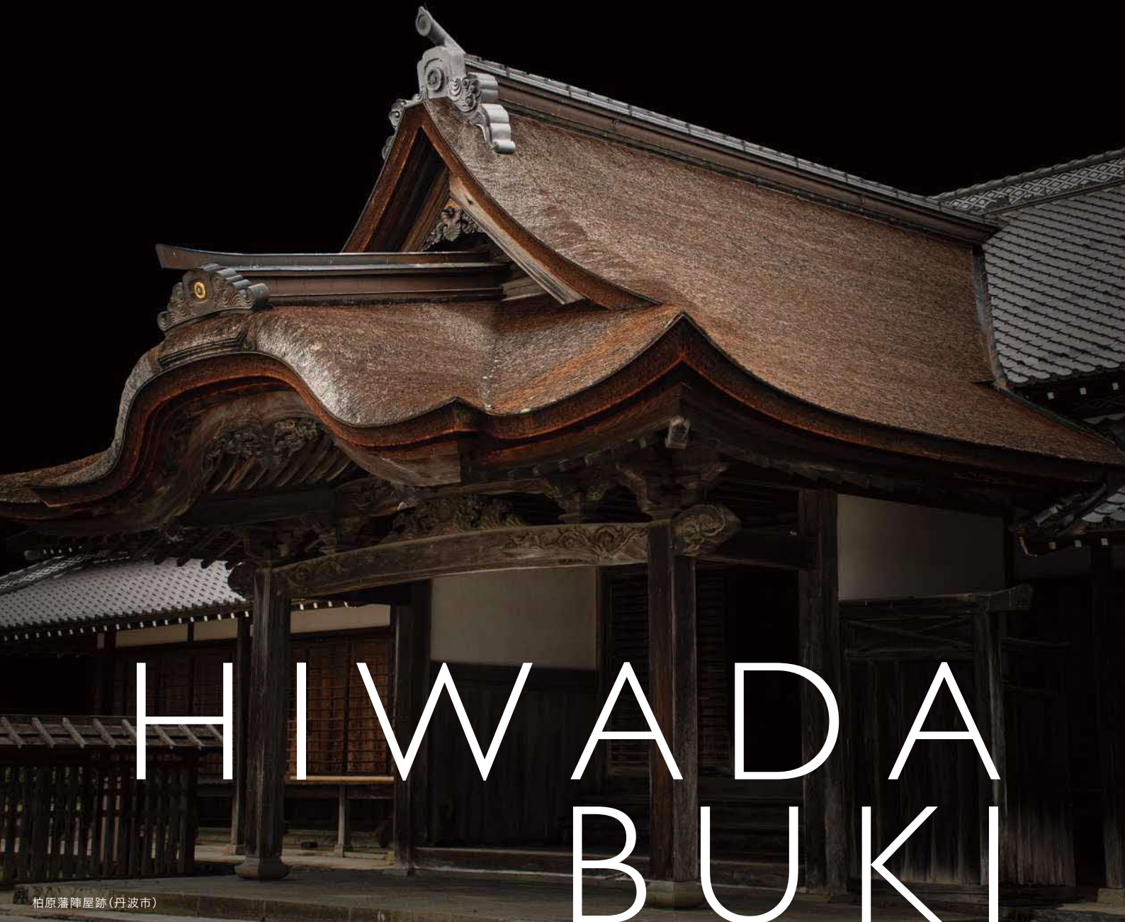
柏原藩陣屋跡(丹波市)