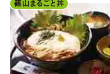
獅子銀 陶の郷店 ㉔ 丹波牛とろろ飯 【価格】1,320円 【所】丹波篠山市今田町上立林3 【カーナビ】「丹波伝統工芸公園」の郷店内で入力 【時】10:00～17:00 【休】火 【問】079-597-2173