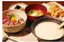
りょうりゅうやまゆ ⑨ 牛とろろ丼膳 【価格】2,860円 【所】丹波篠山市網掛81 【時】11:00～15:00(L.O) 【休】火 【問】079-590-1261