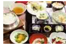
玉川楼 ⑩ 丹波とろろ御膳 【価格】3,300円 【所】丹波篠山市呉服町32 【時】11:00～14:00/17:00～22:00 【休】無休 【問】079-554-2266