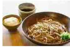
自然庵 ⑥ とろろそば(冷) 【価格】1,200円 【所】丹波篠山市真南条上947-8 【時】11:30～14:30 そばが売切れ次第終了 【休】水・第2第4木 【問】079-550-0727