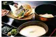
大手新丁 ⑧ むぎとろ大手御膳 【価格】1,600円 【所】丹波篠山市二階町71 【時】11:00～17:00(17:00以降はご予約にて承ります) 【休】不定休 【問】079-554-2777