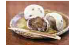
丹波栗葉匠大福堂 ㉑ 栗田舎 (和菓子の皮に山の芋が使われています) 【価格】300円(1個)他にも、丹波栗をまると山の芋で包み込み蒸しあげた「玉水」(1個300円)も販売しております。 【所】丹波篠山市北新町121-1 【時】19:00～18:00 【休】火 【問】079-552-0453