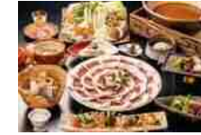
丹波篠山 近又 ⑰ ぼたん鍋 【価格】並身使用8,800円、ロース肉使用11,000円、ロース肉使用・ぼたん焼付13,200円 【所】丹波篠山市二階町81 【時】11:00～21:00 【休】不定休 【問】079-552-2191