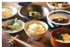
古民家の宿「集落丸山」 ⑪ とろろ 【価格】棟44,000円(1泊朝食付き)＋お一人5,500円 【所】丹波篠山市丸山30 【時】チェックイン15:00～/チェックアウト11:00 【休】不定休 【問】079-506-0243