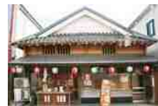
角清 ⑬ にぎり盛りセット 【価格】1,300円、期間中は定食、セットの小鉢をとろろに変更します 【所】丹波篠山市二階町52 【時】12:00～15:00/17:00～22:00 【休】月 【問】079-552-0279