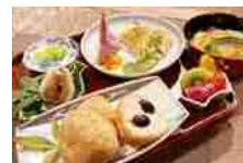
カフェアーボ ⑫ 山の芋ばくだんランチコース 【価格】2,000円 【所】丹波篠山市野中194-2 【時】11:30～17:00(ランチタイム11:30～14:00)(要予約(前日まで)) 【休】日・月・火 【問】079-506-2929