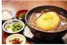
ひいらぎや ① 山芋揚げそば 【価格】1,650円 【所】丹波篠山市二階町56 【時】11:30～売切れ次第終了 【休】木 【問】079-552-5965