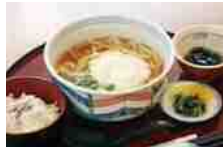
ユニピアささやま ⑤ 丹波篠山山の芋とろろうどん・そば 定食 【価格】1,250円 【所】丹波篠山市矢代231-1 【時】11:30～14:00 【休】無休 【問】079-552-5227