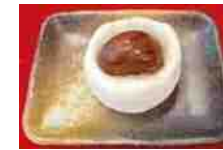
鹿生堂 ㉗ 丹波衣栗上用(要予約) 【価格】300円 【所】丹波篠山市乾新町59 【時】19:00～17:00 【休】木 【問】079-552-0314