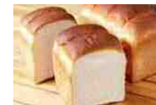
Bakery Cafe HikoOKI ㉘ 山の芋食パン 【価格】700円 【所】丹波篠山市日置144 【時】10:00～17:00 【休】月・火・水 【問】090-6321-6813

新型コロナウイルス感染拡大防止のため実際の営業内容と異なる場合があります。詳しくは各店舗へ直接お問い合わせ下さい。