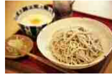
そば切り 花格子 ④ 山の芋つけとろろ蕎麦 【価格】1,400円 【所】丹波篠山市河原町160 【時】11:30～14:00/17:30～20:30(要予約) 【休】日曜夜・月(祝日の場合は翌日)、年末年始 【問】079-552-2808