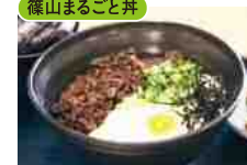
味処みたけ支店 ㉒ 猪肉とろろ丼 【価格】1,100円 【所】丹波篠山市黒岡18 【時】11:00～16:00 【休】不定休 【問】079-552-4888