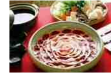
活魚割烹 宝魚園 ⑯ ぼたん鍋 【価格】6,050円 【所】丹波篠山市川北新田52 【時】11:30～14:00/17:00～21:00 【休】火 【問】079-593-1341