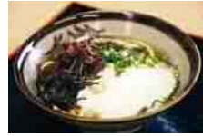
味処みたけ本店 ③ 猪肉とろろうどん・そば 【価格】1,000円 【所】丹波篠山市黒岡683 【時】11:00～17:00 【休】不定休 【問】079-552-1385