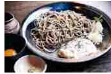
石臼挽き十割そば 夢左工門 ⑦ 山の芋とろろそば 【価格】1,600円 【所】丹波篠山市西門屋209-3 【時】11:30～14:30 そばが売切れ次第終了 【休】火・水・木・金(祝日営業) 【問】079-552-3989