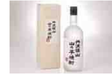
田中正一商店 ⑳ 丹波篠山 山の芋焼酎 【価格】2,530円(720ml)/770円(130ml) 【所】丹波篠山市味間新391-2 【時】10:00～18:00 【休】不定休(要電話) 【問】090-4271-5702