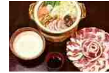
うめたんFUJI ⑱ 山の芋とろろで食べるすまし牡丹鍋コース 【価格】4,400円 【所】丹波篠山市大藤65-3 【時】17:00～24:00(要予約・1日組限定) 【休】なし 【問】090-8450-8602