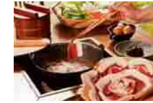
料理旅館 高砂 ⑲ ぼたん鍋 【価格】並6,050円、上7,150円、特上8,250円 フェア期間中ぼたん鍋に山の芋の小鉢が付きます 【所】丹波篠山市二階町6 【時】11:30～21:30(要予約) 【休】火 【問】079-552-2158