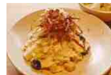
小田垣豆堂 ⑭ 丹波篠山の里山リゾット 【価格】1,700円 【所】丹波篠山市立町19 【時】10:00～16:00(15:30L.O) 【休】木(祝日の場合は翌平日) 【問】079-552-0011