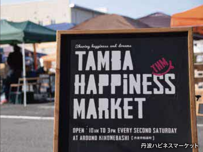
丹波ハピネスマーケット