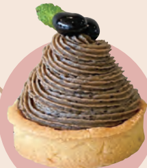
14 里山工房くもべ 黒豆モンブラン