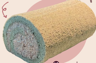
13 manie くろロール