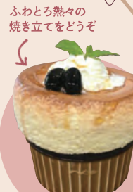
15 カフェ カモット 黒豆スフレ