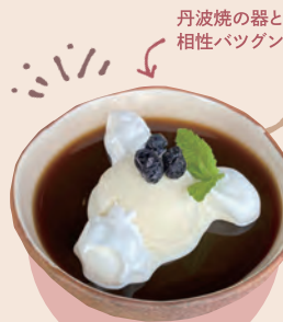
9 虚空蔵 黒豆コーヒーゼリー