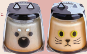
5 和み工房 丹波篠山黒豆プリン クロちゃん & マメちゃん