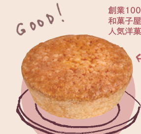
2 梅角堂 ささやまタルト(黒豆)