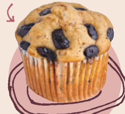
16 マフィン&スコーン fumu fumu 黒豆マフィン