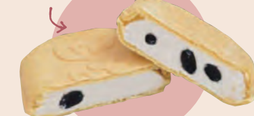
3 丹波篠山食品 黒豆もなか