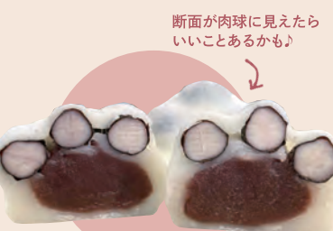
7 大福堂 黒豆大福