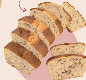
6 熊野園 手作りパウンドケーキ 焙煎黒豆きな粉くるみ