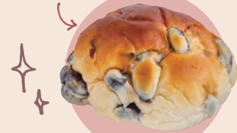
19 小西のパン 小西の黒豆パン