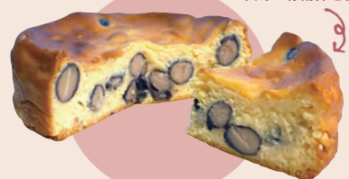
11 雪岡市郎兵衛洋菓子舗 丹波黒豆のチーズケーキ