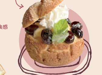
24 洋食レストラン あんず 黒豆シュークリーム