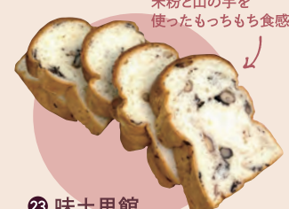
23 味土里館 プレミアム食パン