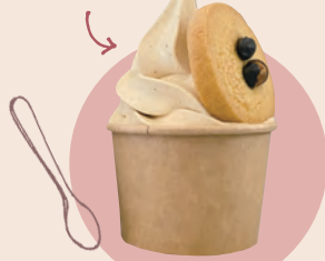
12 丹波篠山百景館 丹波パフェ