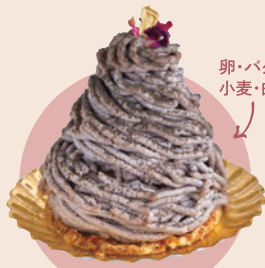
1 Sun Rice Kitchen Vegan 黒豆モンブラン