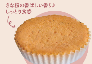
4 手作りケーキのお店 アリス 黒豆マドレーヌ