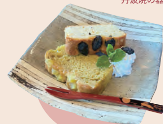
8 獅子銀 陶の郷店 黒豆パウンドケーキ