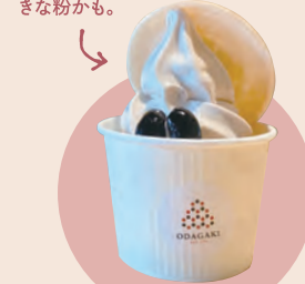
17 小田垣商店 ODAGAKI ソフトクリーム黒豆きなこ