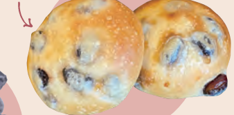
22 天然酵母のパン屋さん 白殻五粉 黒豆くろっこ