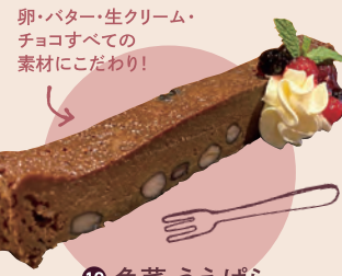
10 魚菜 うえばら 黒豆ガトーショコラ