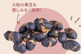
18 篠山食料品店 大粒煎り黒豆