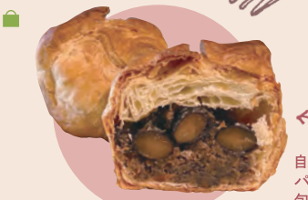
25 五節舎やまゆ 丹波黒豆パイ