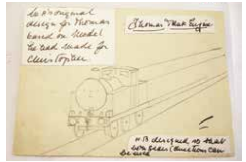
W・オードリー<トーマスのオリジナルデザイン>