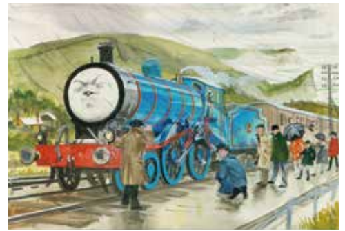
ガンバー&ピーター・エドワーズ『エドワードのはなれわざ』1966年

世界中の子どもたちに愛されている「きかんしゃトーマス」の原作、『汽車のえほん』シリーズがイギリスで出版されてから75周年。