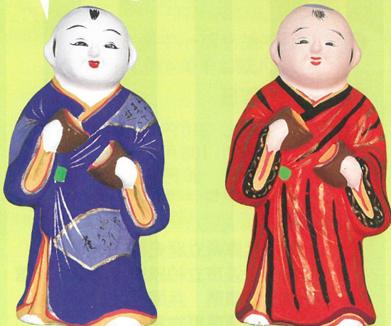
稲畑人形(饅頭食い)