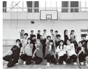
ACT 10 兵庫県立氷上高等学校ダンス部 Rampant