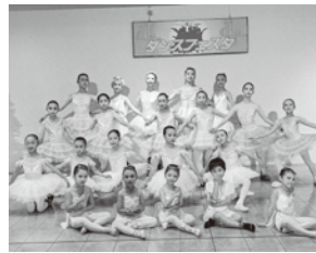
ACT 9 スタジオ・プチ・バレリーナ