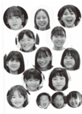
ACT 7 Zeek's