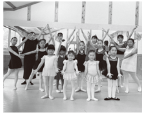
ACT 3 バレエ・テッラドーン