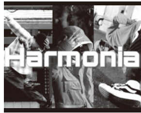
ACT 4 Harmonia