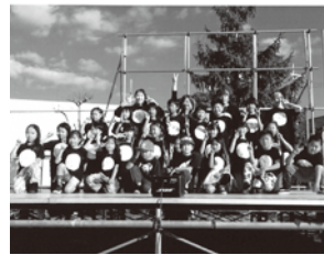
ACT 5 SAWANO COMPANY