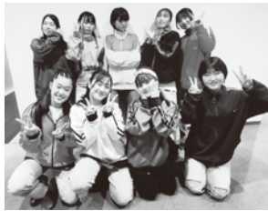
ACT 1 Whippy dance studio