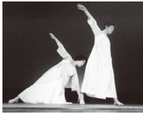
ACT 2 D³.Y