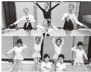
ACT 6 Aogaki Ballet School