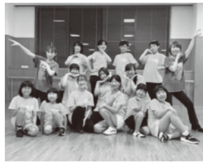
ACT 8 The Asian Roses