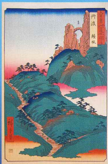
六十余州名所図会 丹波 鐘坂 当館蔵