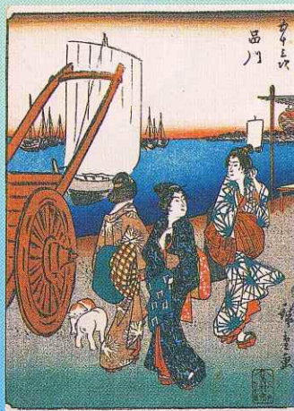
東海道（人物東海道）品川

中でも日本全国の名所を題材とする「六十余州名所図会」に当地の「丹波 鐘坂」が収録されていることから、同シリーズの特別展示を行います。（協力：豊橋市三川宿本陣資料館） ※豊橋市三川宿本陣資料館からの借用作品は会期中に展示替えがあります。 （前期9月18日～10月17日、後期10月19日～11月14日） 表面画像 上：東海道五拾三次之内 箱根湖水園 下：伊勢名所 二見か浦の図