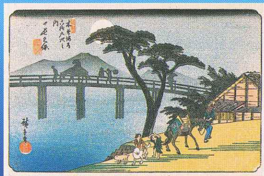
木曾海道六拾九次之内 長久保