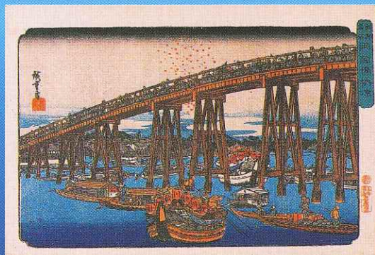
江戸名所 両国橋納涼