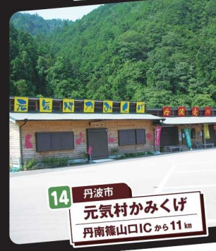
14 丹波市 元氣村かみくげ 丹南篠山ICから11km