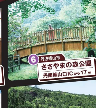
6 丹波篠山市 ささやまの森公園 丹南篠山ICから17km