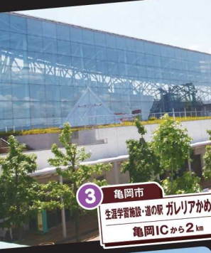
3 亀岡市 生涯学習施設・道の駅 ガレリアかめおか 亀岡ICから2km