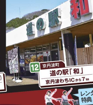
12 京丹波町 道の駅「和」 京丹波わちICから7km