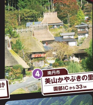
4 南丹市 美山かやぶきの里 園部ICから33km