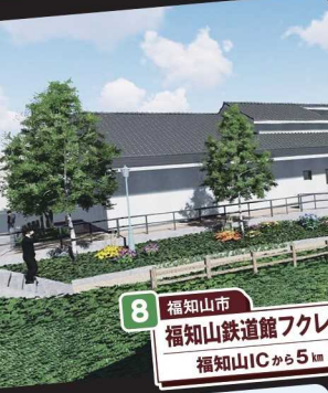
8 福知山市 福知山鉄道館フレール 福知山ICから5km