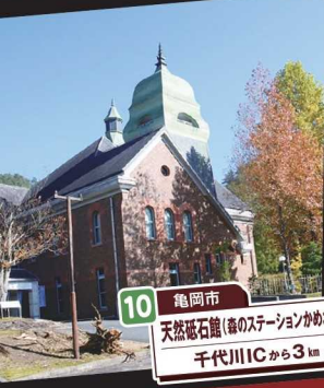
10 亀岡市 天然砥石館(道のステーションかめおか) 千代川ICから3km