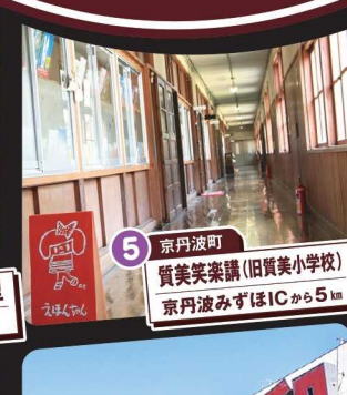
5 京丹波町 質美笑楽講(旧質美小学校) 京丹波みずほICから5km