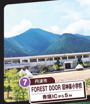
7 丹波市 FOREST DOOR 旧神楽小学校 青垣ICから5km