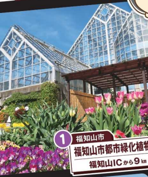
1 福知山市 福知山市都市緑化植物園 福知山ICから9km

2023年 9.1(金)~11.30(木) DAITAMBA DRIVE & CYCLING STAMP RALLY