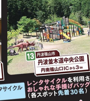
13 丹波篠山市 丹波並木道中央公園 丹南篠山ICから3km