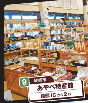
9 綾部市 あやべ特産館 綾部ICから2km