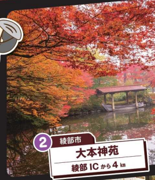
2 綾部市 大本神苑 綾部ICから4km