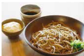
自然薯庵 ⑥ とろろそば(冷) 【価格】1,200円 【所】丹波篠山市真南条上947-8 【時】11:30～14:30 そばが売切れ次第終了 【休】冬期毎週水・木 【問】079-550-0727