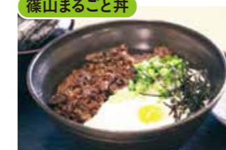
丹波篠山味処みたけ支店 ㉒ 猪肉とろろ丼 【価格】1,100円 【所】丹波篠山市黒岡18 【時】11:00～15:00(L.O.14:30) 【休】不定休 【問】079-552-4888