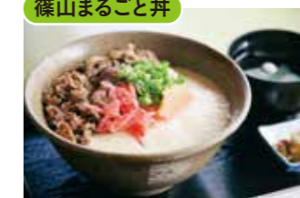
特産館ささやま ㉓ 丹波篠山牛しぐれ丼 【価格】1,375円 【所】丹波篠山市黒岡70-1 【時】11:00～16:00(L.O.15:30) 【休】水 【問】079-552-3386