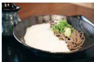
篠山皿そば 武拾六 ② とろろそば 【価格】1,080円 【所】丹波篠山市黒岡19 【時】11:00～そばが売切れ次第終了 【休】火 【問】079-552-6295