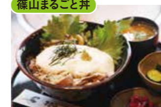
獅子銀 陶の郷店 ㉔ 丹波の牛とろ飯 【価格】1,320円 【所】丹波篠山市今田町上立杭3 【カーナビ】「丹波伝統工芸公園陶の郷内」で入力 【時】10:00～17:00 【休】火 【問】079-597-2173