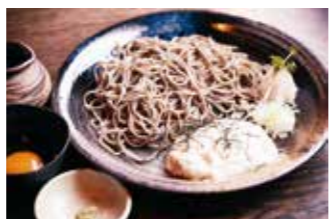
石臼挽き十割そば 多左工門 ⑦ 山の芋とろろそば 【価格】1,600円 【所】丹波篠山市西岡屋209-3 【時】11:30～14:30 そばが売切れ次第終了 【休】火・水・木・金(祝日営業) 【問】079-552-3989