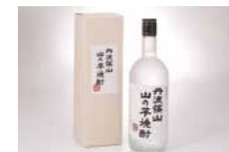
田中正一商店 ⑳ 丹波篠山山の芋焼酎 【価格】2,530円(720ml)/770円(130ml) 【所】丹波篠山市味間新391-2 【時】10:00～18:00 【休】不定休(要電話) 【問】090-4271-5702