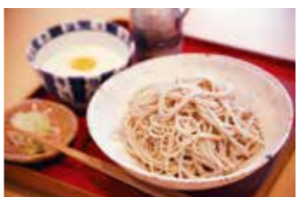
そば切り 花格子 ④ 山の芋つけとろろ蕎麦 【価格】1,650円 【所】丹波篠山市河原町160 【時】11:30～14:30/17:30～20:30 (予約可)蕎麦売切次第閉店 【休】日曜夜・月(祝日の場合は翌日)、年末年始 【問】079-552-2808