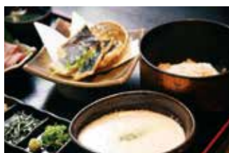
大手新丁 ⑧ むぎとろ大手御膳 【価格】1,700円 【所】丹波篠山市二階町71 【時】11:00～17:00(売切れ次第終了(17:00以降はご予約にて承ります)) 【休】不定休 【問】079-554-2777