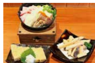
魚菜うえばら ⑮ 地卵と山の芋の出し巻きたまご山の芋のポテトフライ一人鍋山かけぼたん(冬季) 【価格】590円(地卵と山の芋の出し巻きたまご)、580円(山の芋のポテトフライ)、1,750円(一人鍋山かけぼたん(冬季)) 【所】丹波篠山市中野76-4 ホロンピアホテル5F 【時】17:00～23:00(L.O.22:30) 【休】不定休 【問】079-594-2767