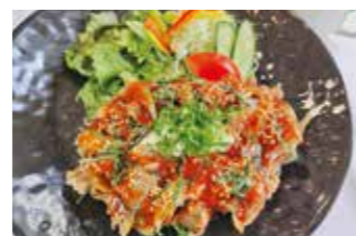
大正ロマン館(カフェレストランマルコッテ) ⑪ 国産牛と丹波篠山産霧芋(山の芋)の牛とろろライスプレート 【価格】1,600円 *仕入れ価格高騰により期間途中での値上げの可能性あり 【所】丹波篠山市北新町97 【時】10:00～17:00(お食事は11:00～16:00) 【休】火曜日(その他臨時休館有り) 【問】079-552-6668