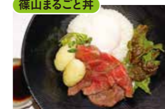
食事処 和多作 ㉕ ローストビーフ丼 【価格】1,980円 【所】丹波篠山市杉271-3 【時】11:00～13:40/17:30～22:00 【休】日・祝・水曜日夜 【問】079-509-0355