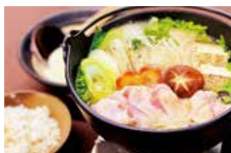
りょうり舎やまゆ ⑨ 丹波地鶏とろろ鍋膳 【価格】4,950円 【所】丹波篠山市網掛81 【時】11:00～15:00(L.O) 【休】火 【問】079-590-1261