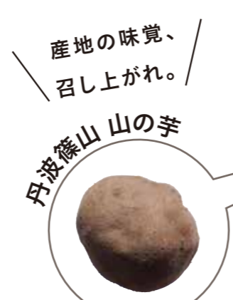
産地の味覚、召し上がれ。 丹波篠山山の芋